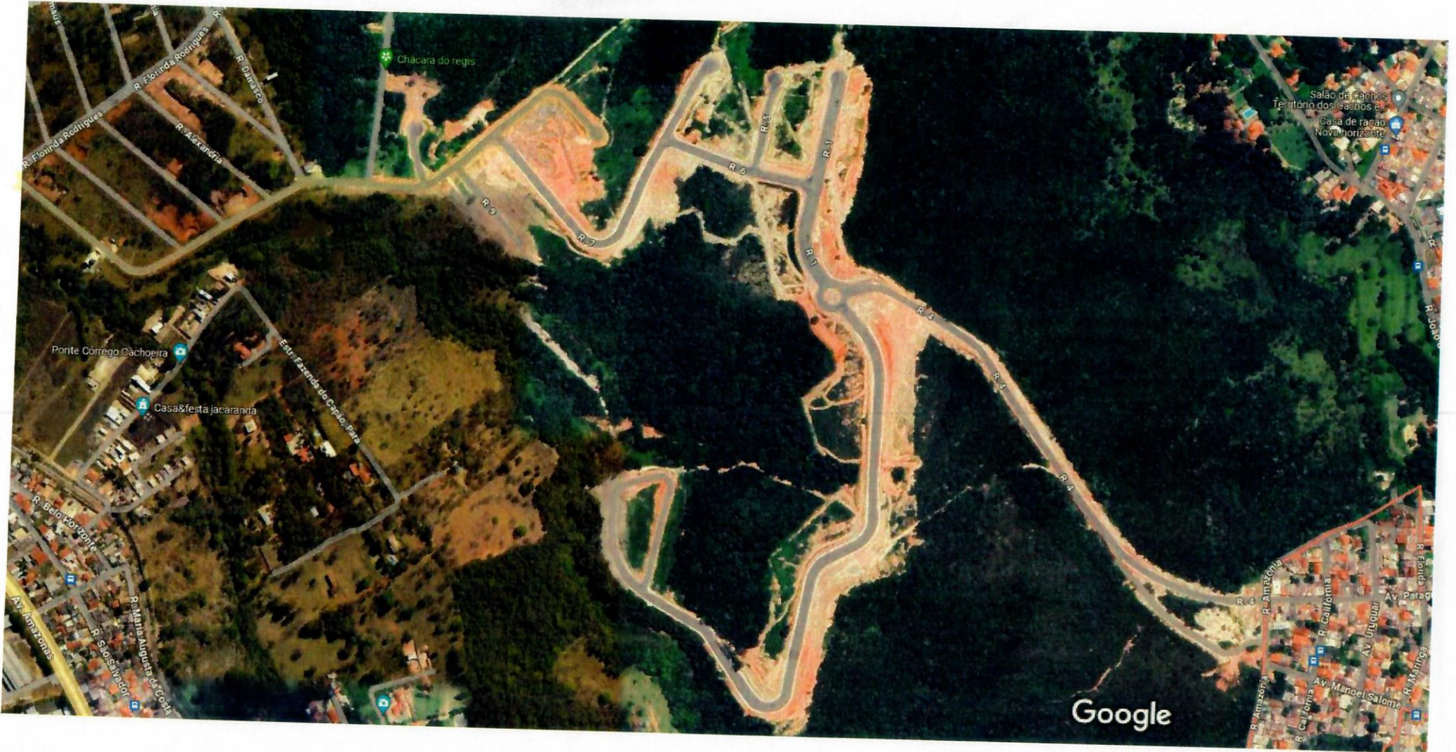
Imagens ©2024 Airbus, CNES / Airbus, Maxar Technologies, Dados do mapa ©2024 100 m